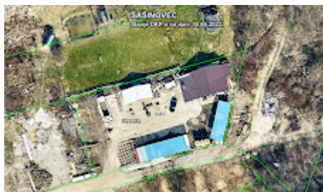
Nova slika (2).bmp 1148K